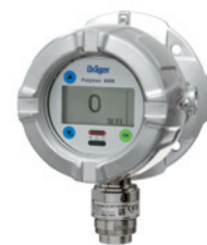
Dräger Polytron 8200 LC с DrägerSensor Ex PR LC для обнаружения низких концентраций взрывоопасных газов и паров.

Одинаковая конструкция, одинаковый принцип действия: Серия Polytron 8000